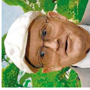
David Hockney Pintor

El cantante español Julio Iglesias, que ha vendido 300 millones de discos en su carrera, afirmó en una entrevista publicada en el diario uruguayo El País que no se retirará de la música porque "no sabría vivir sin ella".