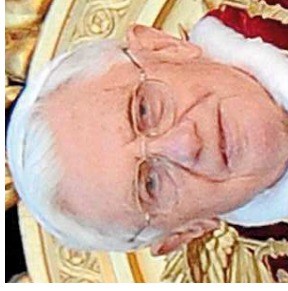
Benedicto XVI Papa

El pintor británico David Hockney, considerado uno de los artistas más influyentes del siglo XX, ha sido galardonado por la reina de Inglaterra, Isabel II, con la Orden de Mérito, según anunció ayer el Palacio de Buckingham.