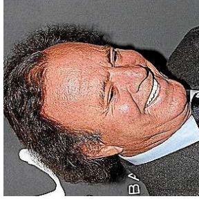
Julio Iglesias Cantante

TENDENCIAS SOCIEDAD CIENCIA CULTURA OCIO